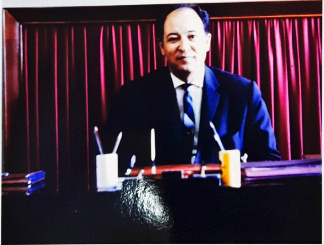
ETİBANK GENEL MÜDÜRÜ-1966